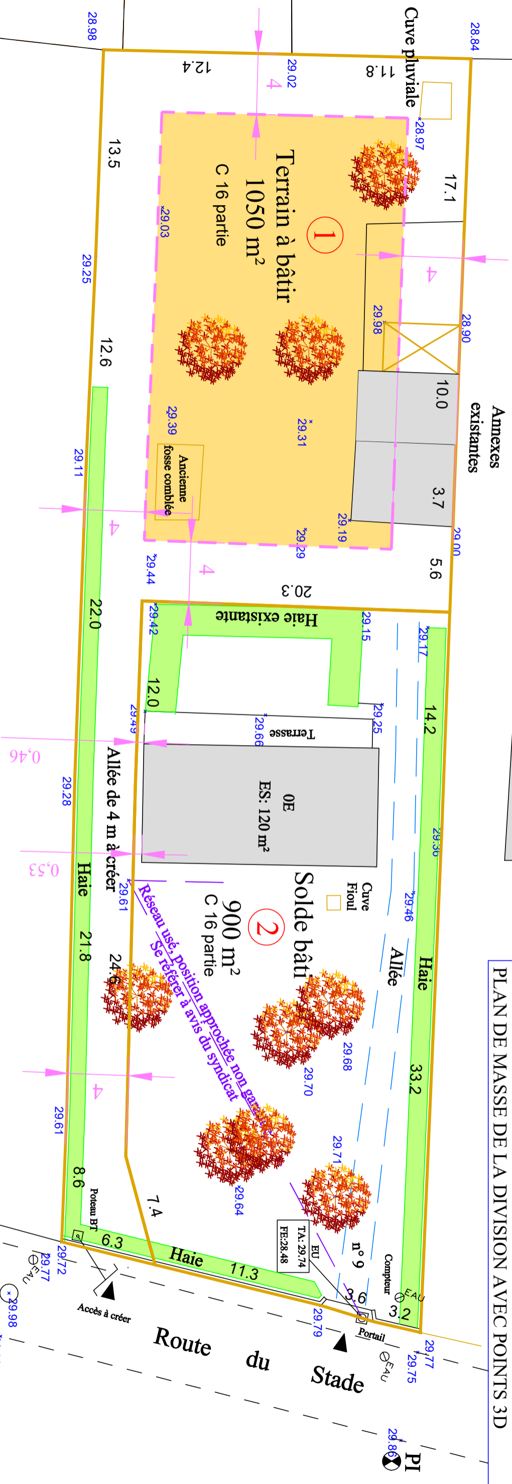
PLAN DE MASSE DE LA DIVISION AVEC POINTS 3D

Lot 2 - Solde bâti = 900 m² (ES existante= 120 m² - Zone UC)